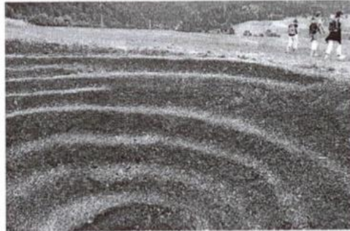
«Bleu du ciel»: Erdsulptur von Katja Schenker.