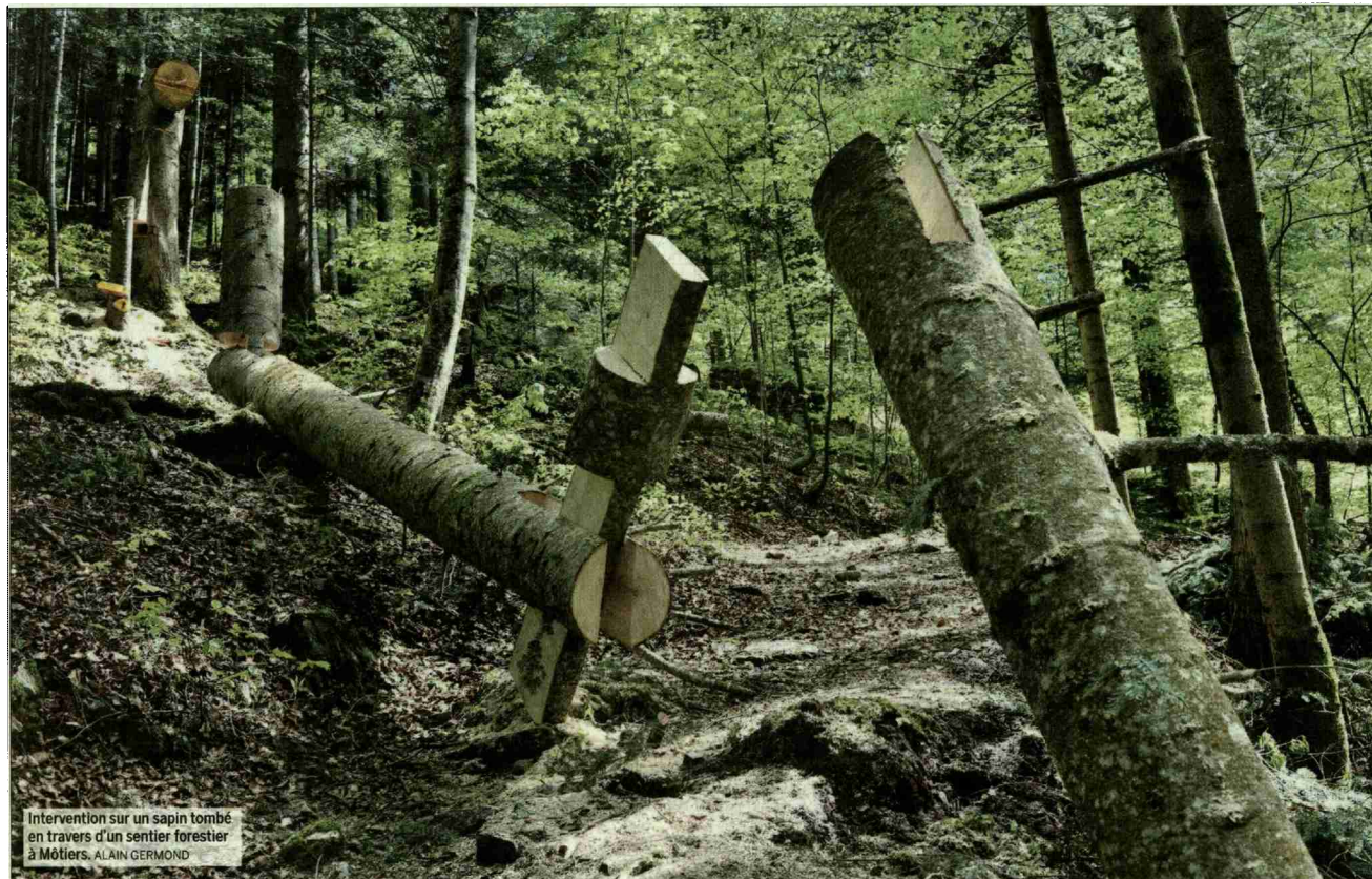
Intervention sur un sapin tombé en travers d'un sentier forestier à Môtiers. ALAIN GERMOND

N° de thème: 820.001 N° d'abonnement: 1096724 Page: 31 Surface: 102'308 mm 2